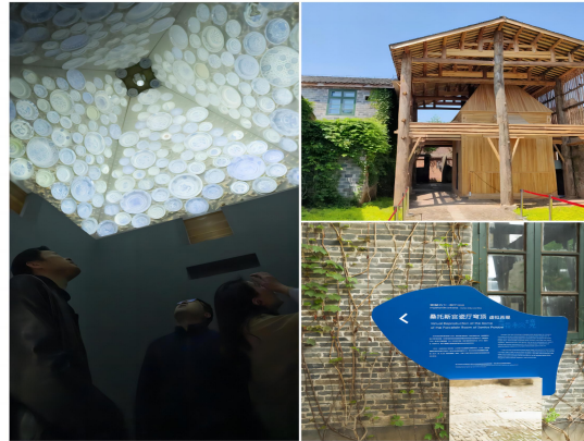
部分展览的现场照片及海报