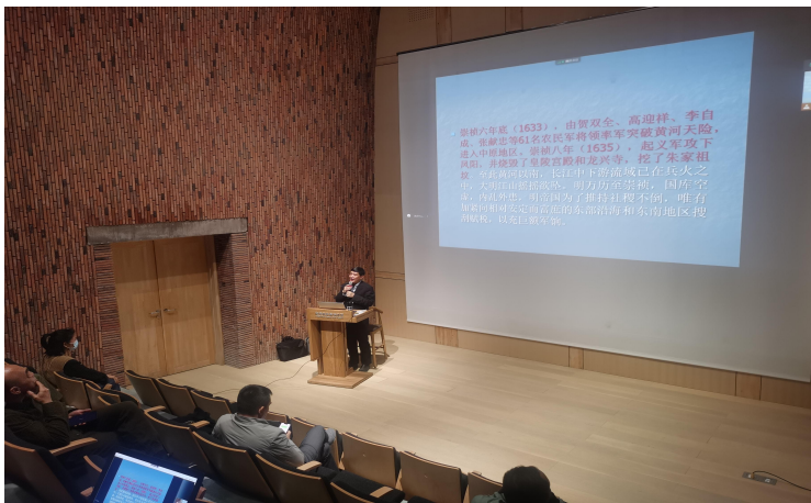
开展线下及线上学术讲座