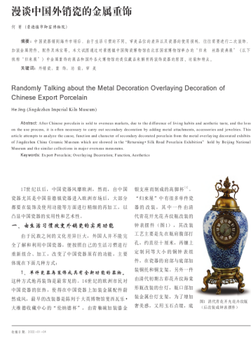
出版、发表学术及科普的著作、论文